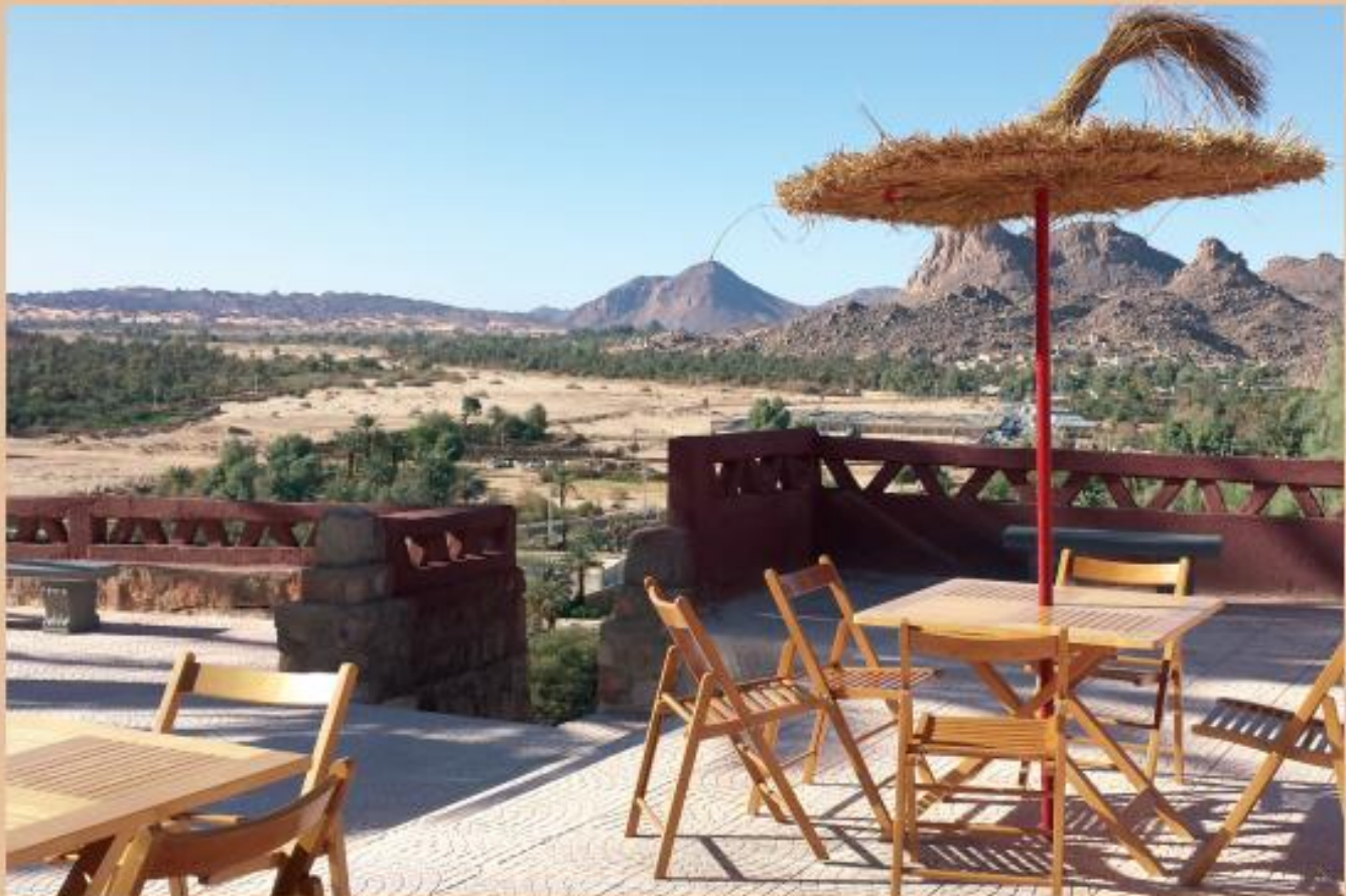
La Résidence ONAT à Djanet