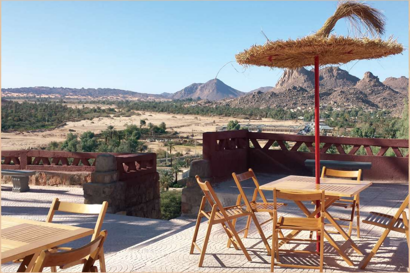
La Résidence ONAT à Djanet